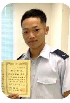
約3か月の自衛官候補生課程を経て多くの仲間、先輩達から色々な事を学ぶ事ができました。私の中で、この3か月という月日は一生忘れることのない、濃い3か月を過ごしました。

お互いに助け合い、協力し合い、時にはみんなで話し合ったりなど、自衛官になるという自覚を持ち自分自身を含め、班員、区隊員で成長することができたと思います。 この3か月に感謝しています。勤務地は石川県の小松基地となり、職種は補給となりました。物品の管理等の業務になります。覚えることが沢山あると思いますが、頑張っ