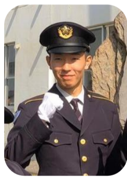
私が、初めて教育隊に着隊したのは、生年月日の関係により他の人たちより1週間遅れてからでした。

先に着隊している人たちが遅れているというので、とても不安な気持ちになりました。ちゃんとやっていけるか心配でした。 そんな中、班長や同じ班の仲間を支えてもらい私は、希望の任地・職種に就くことができ、前期教育課程も無事に終了を迎えることができました。 これからの目標は、昔からの夢である空挺隊員になることと、自分たちを教育してくれた教育隊の班長を経験して、模範となるような立派な陸上自衛官になりたいです。